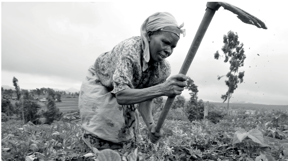
Figura 3: Un ejemplo de agricultura en África Oriental

El nuevo sistema de agricultura inteligente utiliza una aplicación móvil 1 que se conecta a un registrador de datos 2 mediante tecnología Bluetooth (véase la Figura 4 ).