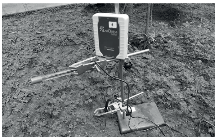
Figura 4: Ejemplo de un registrador de datos

Los datos que recopila la aplicación se envían a la universidad mediante compresión sin pérdida.